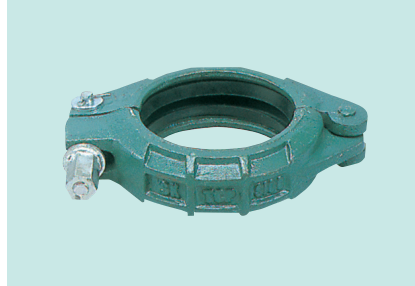
TCPジョイント (S1タイプ) (ワンタッチ)

材 質：ダクタイル サイズ：25A・40A・50A・75A・100A・150A・ 200A (S型は普通のジョイントです)