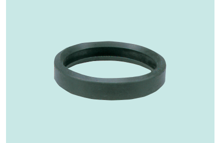
パッキン (ゴムリング) SBR