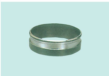
G型カラーリング (グループ型)

サイズ：40A・50A・75A・ 100A・150A・200A (10kg/cm 2 ～30kg/cm 2 )