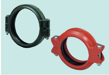
TKJジョイント (SOタイプ) (両ボルト)

材 質：ダクタイル サイズ：25A・40A・50A・75A・100A・150A・ 200A (S型は普通のジョイントです)